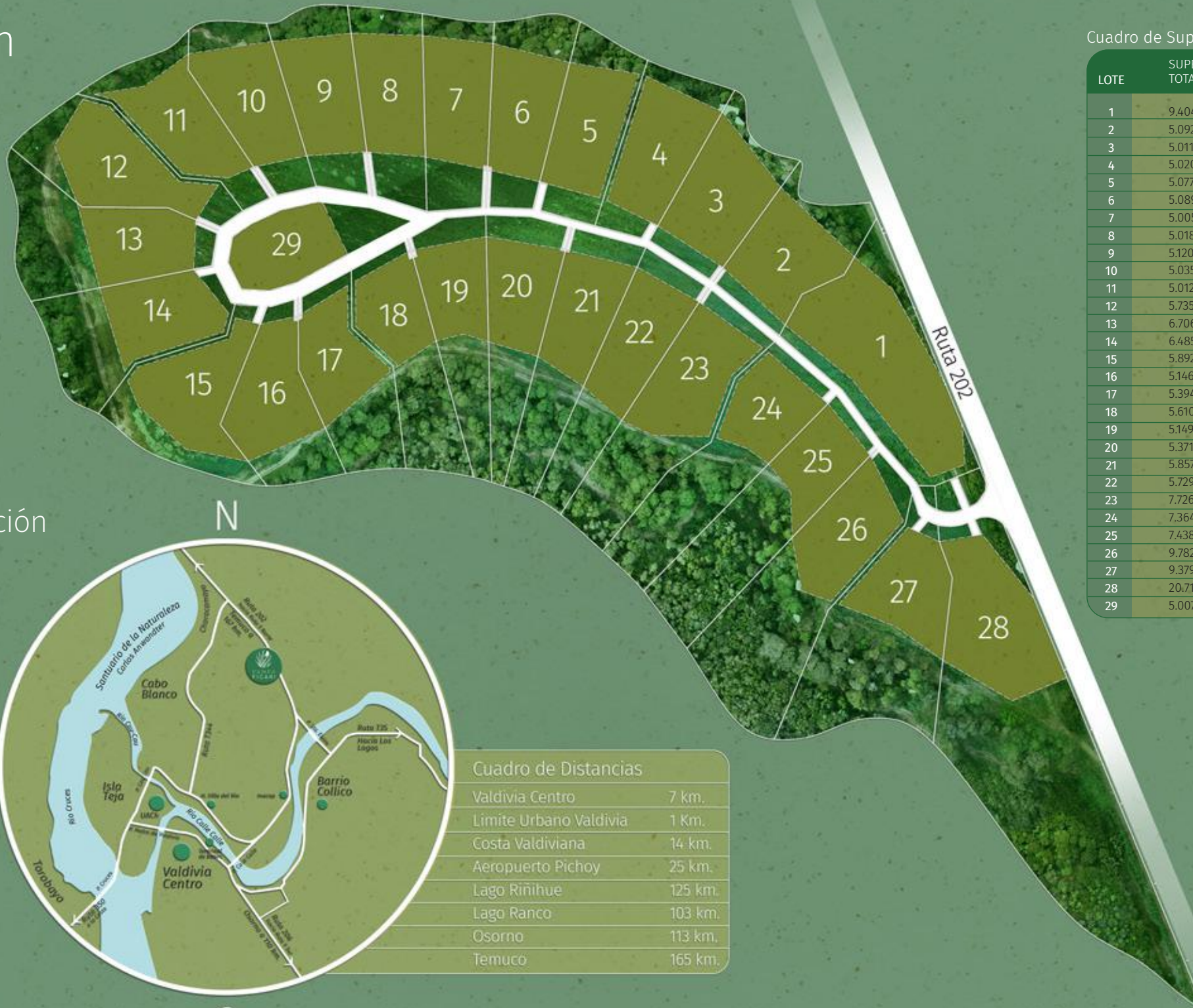
Cuadro de Superficies